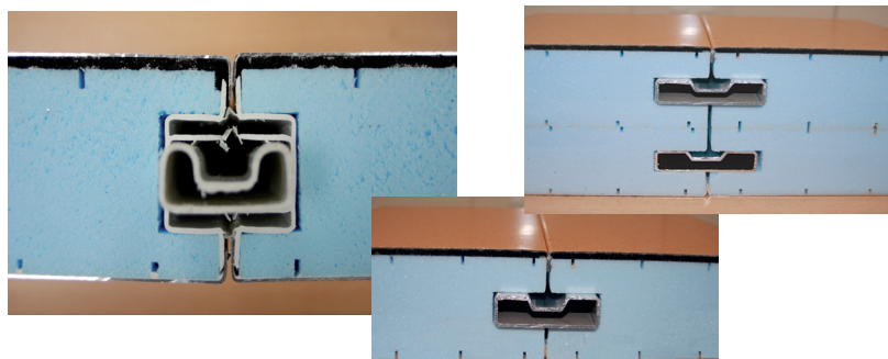
Gama auto portante: Espesor 55, 60, 66, 85, 105 mm Referencias: AXA55+, XA55R16+, XA60R16+, XA66R16+, XA85R16+, XA105R16+