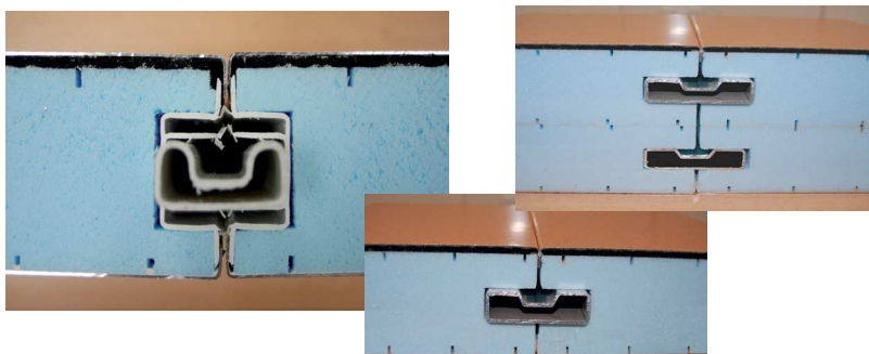
Gamme Auto-portant: épaisseurs 55, 60, 66, 85, 105 mm Références: AXA55+, XA55R16+, XA60R16+, XA66R16+, XA85R16+, XA105R16+